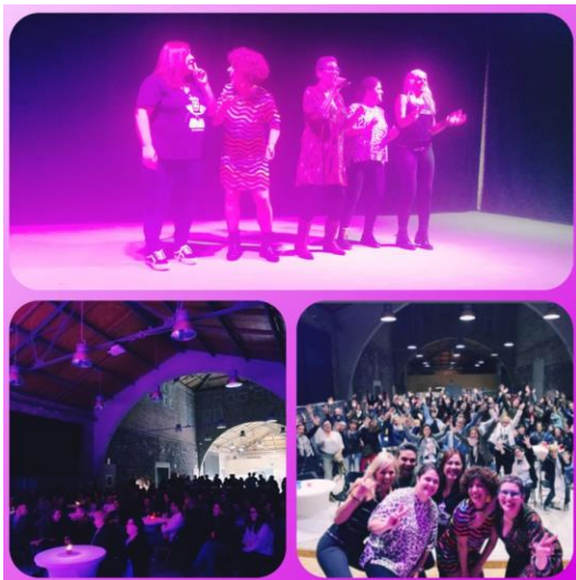
III X-corxador Fest