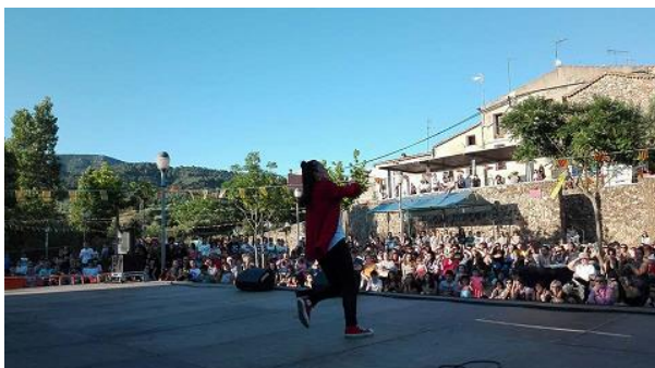
XI Marató d'Artistes