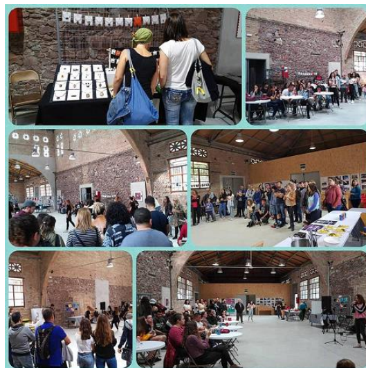
Festival d'Art Jove